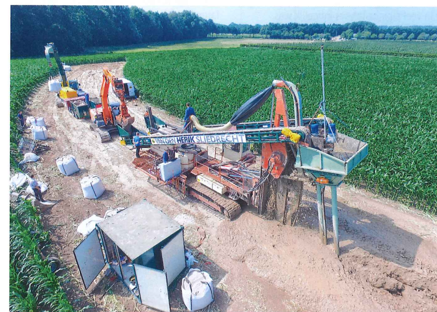
Na jaren van ontwikkeling heeft Van den Herik een machine ontwikkeld die weinig ruimte nodig heeft om een verticaal geotextiel aan te brengen.

Na de maakbaarheidsproef is het systeem doorontwikkeld. Het systeem was nog niet geschikt om het geotextiel in een situatie met weinig ruimte aan te brengen (zoals vaak voorkomt langs de dijken). Het gehele systeem had een breedte nodig van 20 m, en dat is bij de meeste dijken niet voorhanden. Met die opgave is het ontwerpteam van Van den Herik aan de slag gegaan. Diverse aanpassingen hebben ertoe geleid dat het definitieve systeem een enkele werkstrook langs de teen van